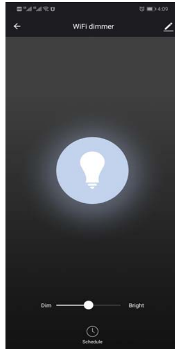
on/off y regulación